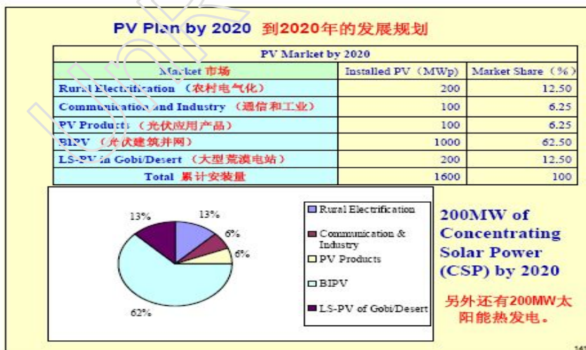
图3 中国到2020年的光伏发电市场份额预测

我国BIPV系统的研究与开发也已取得了很大的发展。根据我国制定的光伏产业规划预测：到2020年光伏建筑并网发电量要占到光伏总发电量的62.5%，（见图3）。由于我国建筑光伏一体化起步较晚，目前在国内还处于示范阶段。