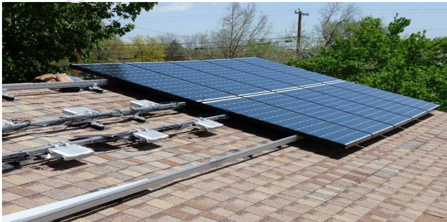
图1 光伏方阵依附于建筑物上

建筑光伏一体化（BIPV）可分为两大类：一类是光伏方阵与建筑的结合。这种方式是将光伏方阵依附于建筑物上，充分利用现有建筑物的空闲空间，将建筑物作为光伏方阵载体，起支承作用（见图1）。有人把它简称叫支架型，光伏系统跟这个房子没多大关系，只是借用了房屋屋顶或立面的面积。支架型方式也可应用在荒漠、非农用地面上等。另一类是光伏方阵与建筑的集成（见图2），比如光伏采光顶及幕墙。光伏组件作为建筑物的构件，光伏方阵变成了建筑物不可分割的一部分。由于房屋屋顶或立面有较多的受光面积，同时便于安装，光伏方阵与建筑的结合不占用额外的地面空间，因此光伏采光顶或幕墙在国外得到了广泛应用。